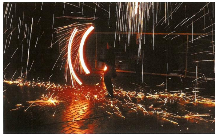
Die Feuershow im November

der Trägerverein für die nächsten drei bis fünf Jahre einen „lokalen Aktionsplan“ aufstellen. Für die Umsetzung werden ein Sozialarbeiter sowie eine angehende Sozialarbeiterin zunächst als Teilzeitkräfte eingesetzt. An den Personalkosten sowie den entstehenden Sachkosten beteiligt sich der Trägerverein zu 50 Prozent.