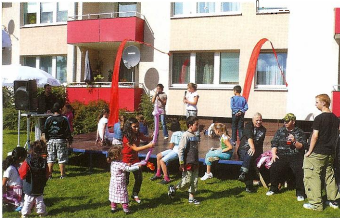
Buntes Treiben beim Sommerfest im Stadtfeld